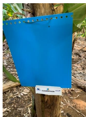
Figura 3 e 4 – Armadilhas cromotrópicas amarelas e azuis.

Os tisanópteros (Thysanoptera) são pequenos insetos com uma coloração que vai de amarela, passando por castanho-escuro até atingir a cor preta (Fig.1). A presença de dois pares asas franjadas nos seus adultos é característica (Fig.1).