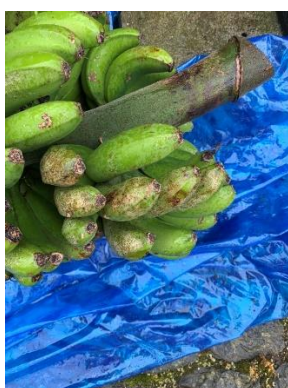
Figura 2 – Aspeto estrago na banana de tripes.