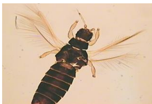
Figura 1 – Adulto de tripe da bananeira ( Heliothrips haemorrhoidalis Bouché).