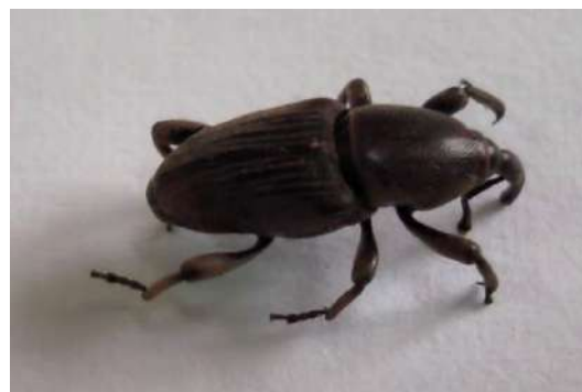
Figura 1 - Adulto de gorgulho da bananeira.