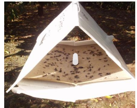
Figura 4 - Armadilha Delta com placa de cola e feromona sexual (no centro).

O adulto da traça da batata ( Phthorimaea operculella Zeller) é uma pequena borboleta pertencente às traças da batateira (Fig. 2). É uma praga importante principalmente da batata armazenada.