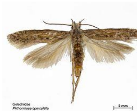
Figura 2- Adulto de Phthorimaea operculella .