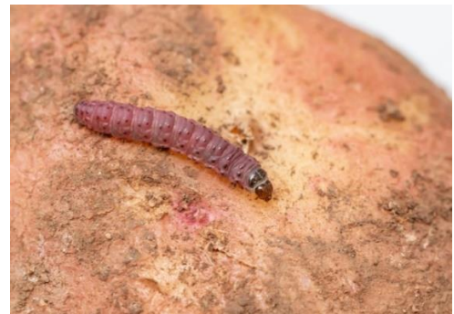
Figura 1- Lagarta de Phthorimaea operculella .

Praga: Traça comum da batata Phthorimaea operculella Zeller (Lepidoptera: Gelechiidae)