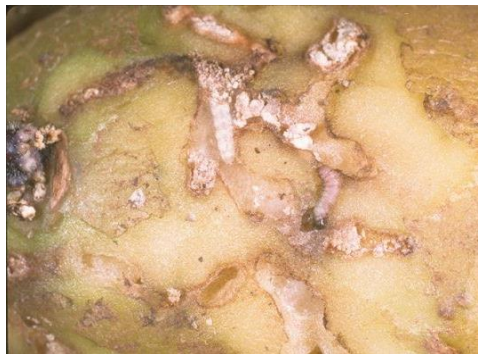
Figura 3- Estragos causados pelas lagartas de Phthorimaea operculella .