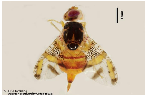
Figura 1- Adulto fêmea de Ceratitis capitata Wied.