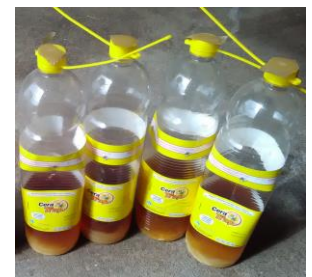
Figura 5 - Armadilha Ceratrapp com atrativo alimentar.

A mosca do Mediterrâneo ( Ceratitis capitata Wied.) (Fig. 1 e 2) é mais pequena que a mosca doméstica. Possui um corpo escuro com duas listas amarelas no abdómen (Fig. 1 e 2). As asas apresentam sinais castanhos, amarelos, pretos e brancos (Fig. 1 e 2).