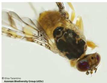
Figura 2- Adulto macho de Ceratitis capitata Wied.