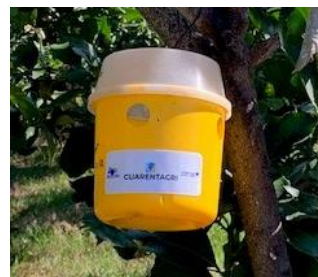
Figura 4 - Armadilha Tephri com atrativo alimentar (trimolure).