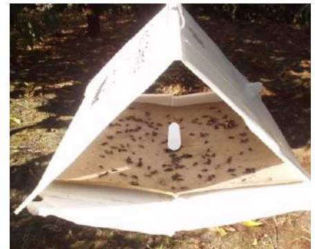
Figura 4 - Armadilha Delta com placa de cola e feromona sexual (no centro).

O adulto da traça da batata ( Phthorimaea operculella Zeller) é uma pequena borboleta pertencente às traças da batateira (Fig. 2). É uma praga importante principalmente da batata armazenada.