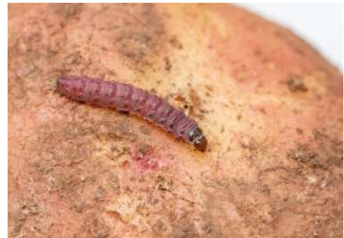
Figura 1- Lagarta de Phthorimaea operculella .

Phthorimaea operculella Zeller (Lepidoptera: Gelechiidae)