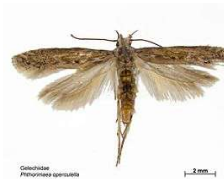
Figura 2- Adulto de Phthorimaea operculella .