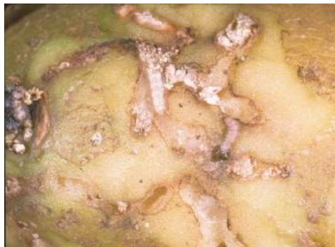
Figura 3- Estragos causados pelas lagartas de Phthorimaea operculella .