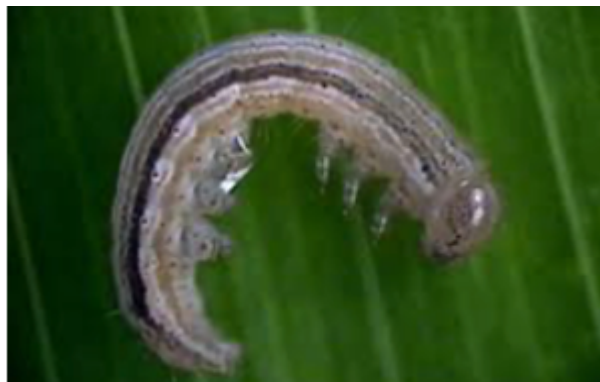
Figura 1 – Lagarta de Mythimna unipuncta (Haworth).

Cultura: Milho/Pastagem Praga: Lagarta da Pastagem Mythimna unipuncta (Haworth) (Lepidoptera: Noctuidae)