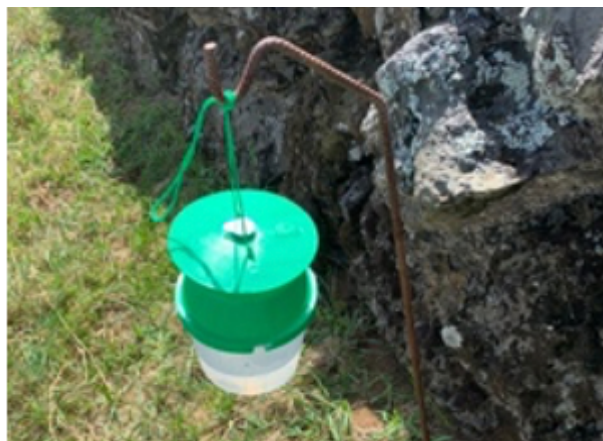
Figura 3 – Armadilha Funil com feromona específica utilizada na monitorização das borboletas (adultos) de M. unipuncta (Haworth).

A lagarta da pastagem ( Mythimna unipuncta Haworth) (Fig. 1) possui lateralmente 3 faixas longitudinais com pequenos pontos ou manchas negras que ajudam no seu reconhecimento visual (Fig. 1). Provoca pela sua alimentação grandes prejuízos nas pastagens e no milho.