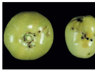
Figura 4 - Estragos característicos da traça-do-tomateiro nos frutos