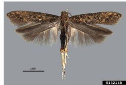
Figura 1- Adulto de Tuta absoluta

Cultura: Tomate Praga: Traça do tomateiro Tuta absoluta Meyrick