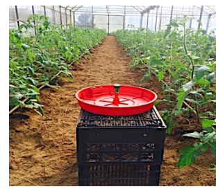
Figura 5 - Armadilha de prato com feromona sexual específica.

O adulto da traça-do-tomateiro ( Tuta absoluta Meyrick) é uma borboleta (Fig.1) e esta é uma das pragas mais agressivas que ataca as folhas desta planta. A sua lagarta (Fig. 2) constrói pela sua alimentação galerias nas folhas reduzindo assim o tecido fotossintético (Fig.3). Nos frutos, os estragos são muito graves, uma vez que as lagartas penetram no seu interior (Fig.4), depreciando-os completamente.