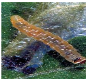
Figura 2- Lagarta de Tuta absoluta .