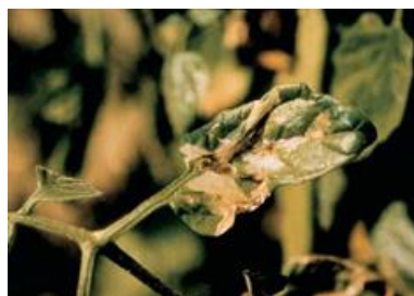
Figura 3- Estragos característicos da traça-do-tomateiro nas folhas.