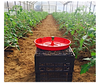
Figura 5 - Armadilha de prato com feromona sexual específica.

O adulto da traça-do-tomateiro ( Tuta absoluta Meyrick) é uma borboleta (Fig.1) e esta é uma das pragas mais agressivas que ataca as folhas desta planta. A sua lagarta (Fig. 2) constrói pela sua alimentação galerias nas folhas reduzindo assim o tecido fotossintético (Fig.3). Nos frutos, os estragos são muito graves, uma vez que as lagartas penetram no seu interior (Fig.4), depreciando-os completamente.