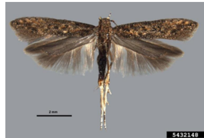
Figura 1- Adulto de Tuta absoluta

Cultura: Tomate Praga: Traça do tomateiro Tuta absoluta Meyrick