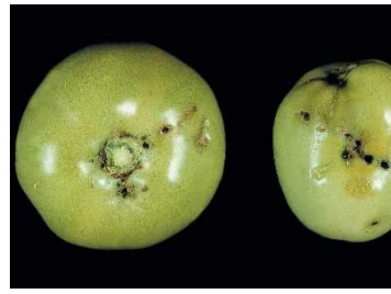
Figura 4 - Estragos característicos da traça-do-tomateiro nos frutos