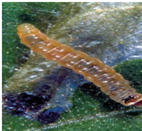
Figura 2- Lagarta de Tuta absoluta .