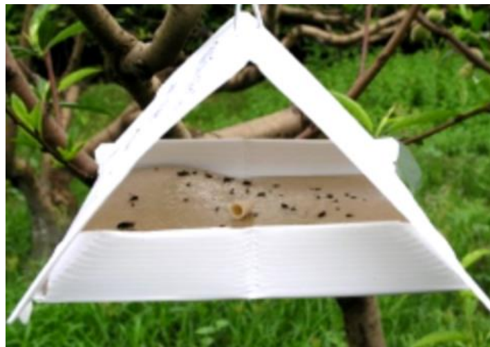
Figura 3 –Armadilha Delta de monitorização do bichado-da-macieira com placa de cola com feromona sexual específica.

Os adultos (borboletas) do bichado da macieira (Fig.1) surgem em junho registando-se os seus maiores picos populacionais em julho e agosto.