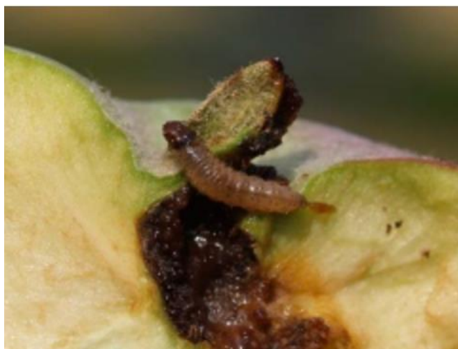
Figura 2 – Lagarta de bichado-da-macieira e estragos causados no fruto.