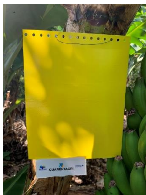
Figura 3 – Armadilhas cromotrópicas amarelas e azuis.