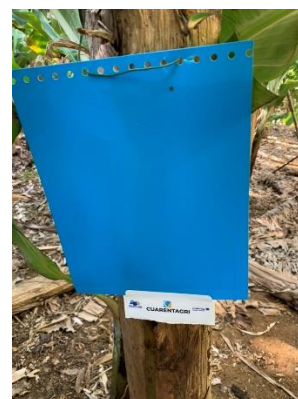
Figura 3 – Armadilhas cromotrópicas amarelas e azuis.

Os tisanópteros (Thysanoptera) são pequenos insetos com uma coloração que vai de amarela, passando por castanho-escuro até atingir a cor preta (Fig.1). A presença de dois pares asas franjadas nos seus adultos é característica (Fig.1).