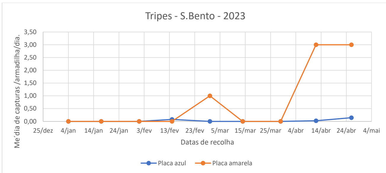
Figura 2- Evolução das capturas de tripes no pomar de bananeira da freguesia de S.Bento, no ano 2023.