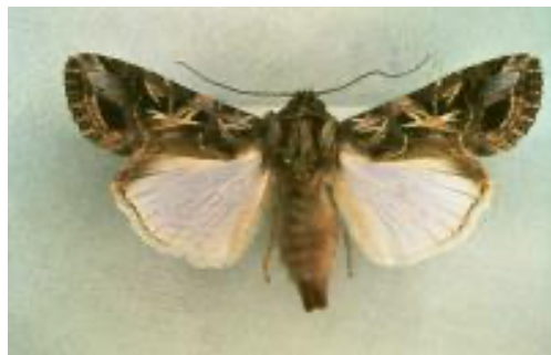
Figura 2 – Adulto de Spodoptera littoralis .