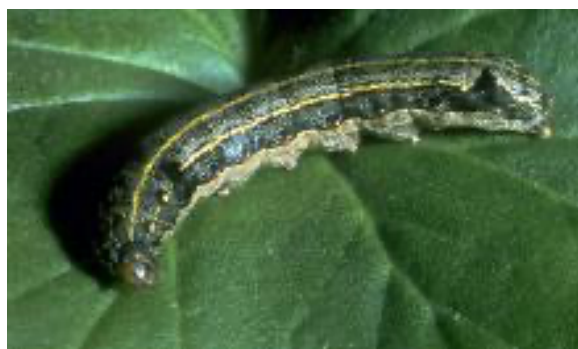
Figura 1 – Lagarta de Spodoptera littoralis .

Praga: Nóctua da pastagem Spodoptera littoralis Boisduval (Lepidoptera: Noctuidae)