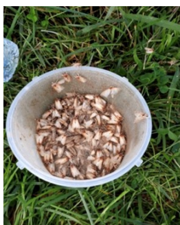
Figura 3 – Aspeto do conteúdo da armadilha grandes quantidades de adultos desta praga.