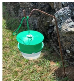
Figura 4 – Armadilha Funil.