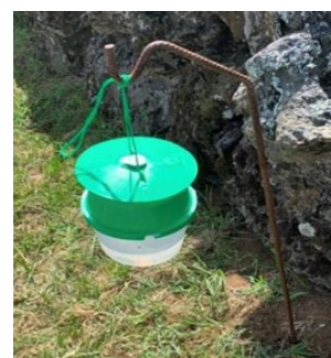
Figura 4 – Armadilha Funil.