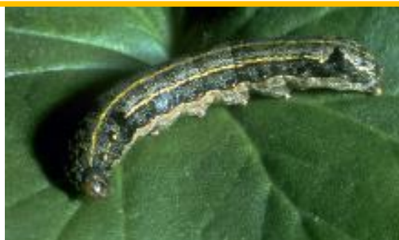
Figura 1 – Lagarta de Spodoptera littoralis .

Praga: Nóctua da pastagem Spodoptera littoralis Boisduval (Lepidoptera: Noctuidae)