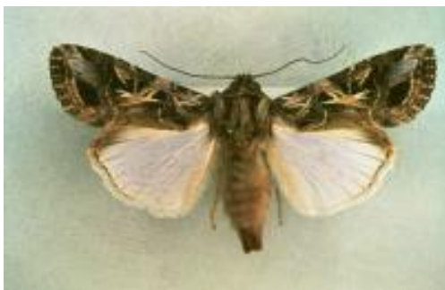
Figura 2 – Adulto de Spodoptera littoralis .

Para a monitorização dos adultos da nóctua da pastagem utiliza-se a armadilha Funil (Fig.4) com feromona sexual específica .