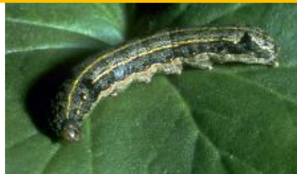
Figura 1 – Lagarta de Spodoptera littoralis .

Praga: Nóctua da pastagem Spodoptera littoralis Boisduval (Lepidoptera: Noctuidae)