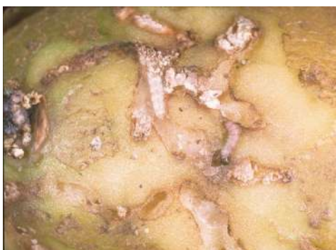
Figura 3- Estragos causados pelas lagartas de Phthorimaea operculella .