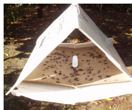
Figura 4 - Armadilha Delta com placa de cola e feromona sexual (no centro).

O adulto da traça da batata ( Phthorimaea operculella Zeller) é uma pequena borboleta pertencente às traças da batateira (Fig. 2). É uma praga importante principalmente da batata armazenada.