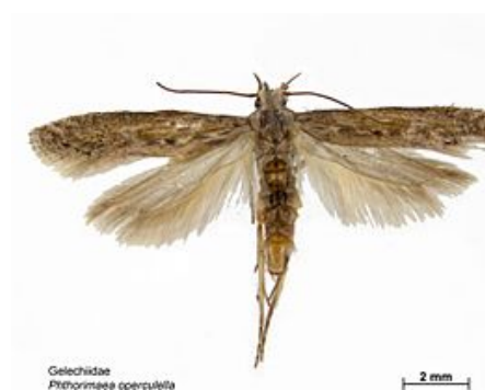
Figura 2- Adulto de Phthorimaea operculella .