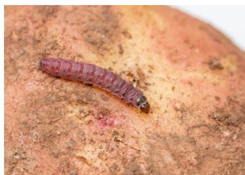
Figura 1- Lagarta de Phthorimaea operculella .

Phthorimaea operculella Zeller (Lepidoptera: Gelechiidae)