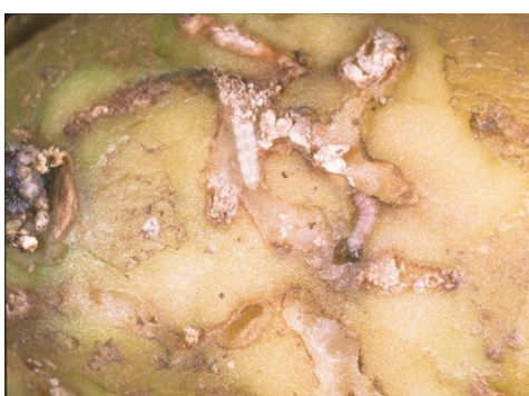
Figura 3- Estragos causados pelas lagartas de Phthorimaea operculella .