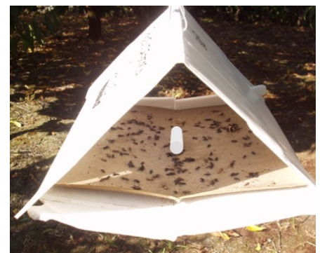
Figura 4 - Armadilha Delta com placa de cola e feromona sexual (no centro).

O adulto da traça da batata ( Phthorimaea operculella Zeller) é uma pequena borboleta pertencente às traças da batateira (Fig. 2). É uma praga importante principalmente da batata armazenada.