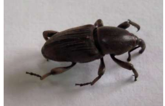
Figura 1 - Adulto de gorgulho da bananeira.