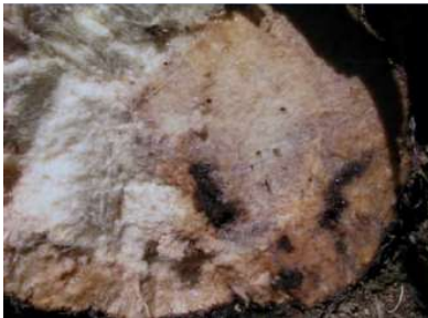
Figura 2- Galerias causadas pelas larvas de gorgulho no interior do pseudo-caule da bananeira.