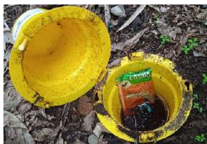
Figura 3 - Armadilha Cosmotrack com a feromona de agregação Cosmoplus

O gorgulho da bananeira (Fig. 1) é uma praga-chave da bananeira nos Açores.