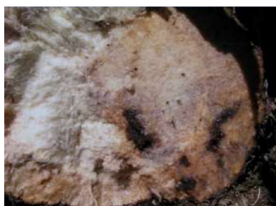
Figura 2- Galerias causadas pelas larvas de gorgulho no interior do pseudo-caule da bananeira.