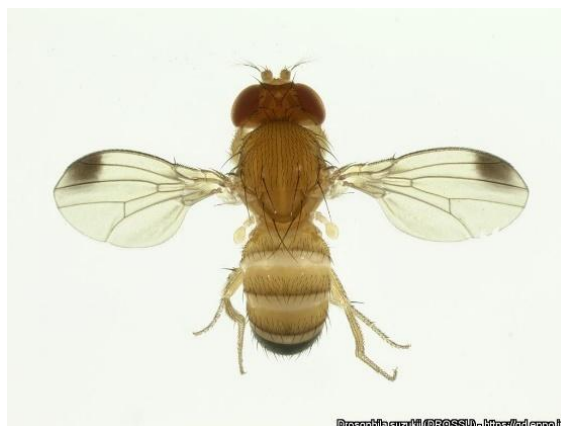
Drosophila suzukii (BR0851) - https://p.ippel.it

Para a monitorização da Drosophila suzukii nas parcelas em estudo foram colocadas armadilhas DrosoTrap com drosalure.