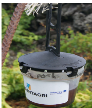
Figura 3 – Armadilha Drosotrap com atrativo drosalure