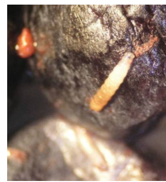
Figura 5 – Larva da mosca da asa manchada ( D. suzukii ).

A mosca da asa manchada ( D. suzukii Matsumura) (Fig. 1) é uma praga polífaga que causa prejuízos em diversas culturas como: o morango (onde regista populações elevadas); mirtilo; amora; framboesa; cereja; ameixa; pêsego; e damasco, podendo também afetar uvas, figos, dióspiros e quivis.