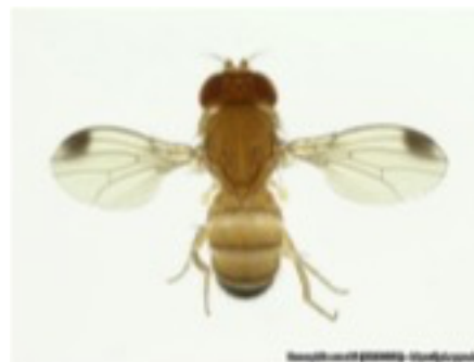
Figura 1- Adulto macho da mosca da asa manchada ( D. suzukii ).