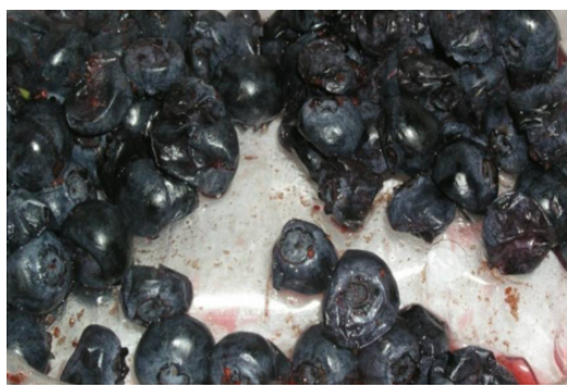
Figura 4 – Estragos da mosca da asa manchada ( D. suzukii ) em mirtilos.