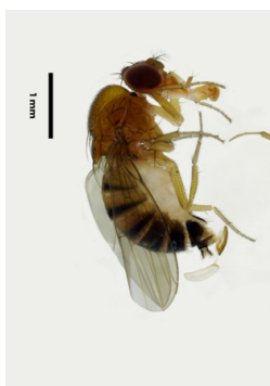
Figura 2 - Adulto fêmea da mosca da asa manchada ( D. suzukii ).