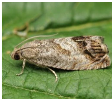
Figura 2 - Borboleta (adultos) de Bichado-da-castanha.