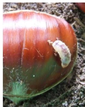
Figura 4 – Lagarta de Bichado-da-castanha saindo do fruto para pupar no solo.