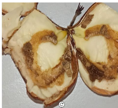
Figura 3 – galerias provocadas pela lagarta de Bichado-da-castanha no interior do fruto.