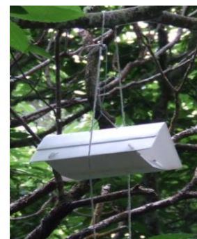
Figura 5 –Armadilha Delta de monitorização do Bichado-da-castanha com feromona sexual específica.

O bichado-da-castanha ( Cydia splendana Hb.) (Fig. 1) é a principal praga da castanha.