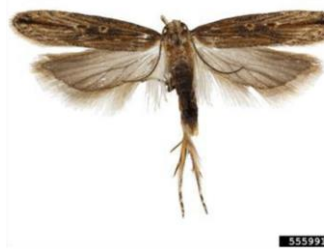
Figura 2 – Adulto macho de Tecia solanivora Polvony.

As armadilhas Delta com feromona sexual específica (Fig.5) são utilizadas para a monitorização desta praga, quer no campo quer nos armazéns onde os tubérculos são armazenados.