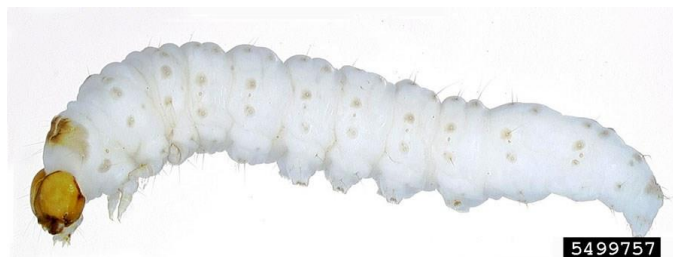
Figura 1 – Lagarta de Tecia solanivora Polvony

Cultura: Batateira Praga: Traça da batateira Tecia solanivora Povolný (Lepidoptera: Gelechiidae)