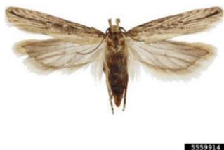
Figura 3 – Adulto fêmea de Tecia solanivora Polvony.