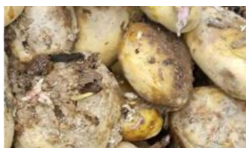
Figura 4 –Estragos causados pelas lagartas de Tecia solanivora Polvony nos tubérculos da batateira.