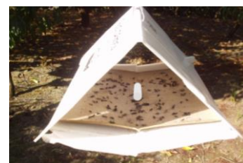
Figura 5 –Armadilha Delta com feromona específica usada na monitorização dos adultos de Tecia solanivora Polvony.