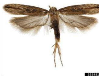
Figura 2 – Adulto macho de Tecia solanivora Polvony.

Em termos do seu ciclo de vida, no armazém, os adultos (Fig. 2 e 3) têm uma atividade noturna, voando curtas distâncias e normalmente junto ao chão. Nos tubérculos afetados (Fig.4), após a eclosão, as lagartas (Fig. 1) penetram nos tubérculos através de orifícios de entrada ou através dos olhos do tubérculo (Fig.4). No campo, os sinais dos estragos aparecem nos tubérculos que apresentam orifícios de saída das lagartas (Fig.4).