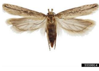
Figura 3 – Adulto fêmea de Tecia solanivora Polvony.