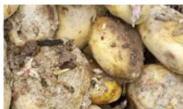
Figura 4 –Estragos causados pelas lagartas de Tecia solanivora Polvony nos tubérculos da batateira