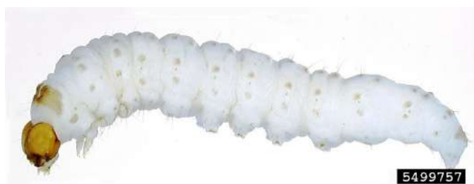
Figura 1 – Lagarta de Tecia solanivora Polvony

Cultura: Batateira Praga: Traça da batateira Tecia solanivora Povolný (Lepidoptera: Gelechiidae)