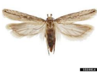
Figura 3 – Adulto fêmea de Tecia solanivora Polvony.