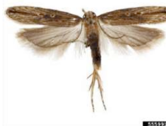
Figura 2 – Adulto macho de Tecia solanivora Polvony.

Em termos do seu ciclo de vida, no armazém, os adultos (Fig. 2 e 3) têm uma atividade noturna, voando curtas distâncias e normalmente junto ao chão. Nos tubérculos afetados (Fig.4), após a eclosão, as lagartas (Fig. 1) penetram nos tubérculos através de orifícios de entrada ou através dos olhos do tubérculo (Fig.4). No campo, os sinais dos estragos aparecem nos tubérculos que apresentam orifícios de saída das lagartas (Fig.4).