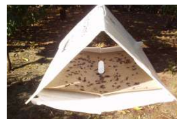
Figura 5 –Armadilha Delta com feromona específica usada na monitorização dos adultos de Tecia solanivora Polvony.

As armadilhas Delta com feromona sexual específica (Fig.5) são utilizadas para a monitorização desta praga, quer no campo quer nos armazéns onde os tubérculos são armazenados.