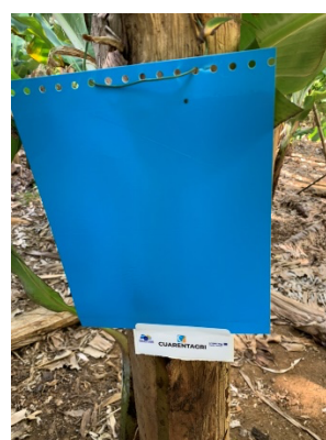
Figura 3 e 4 – Armadilhas cromotrópicas amarelas e azuis.

Os tisanópteros (Thysanoptera) são pequenos insetos com uma coloração que vai de amarela, passando por castanho-escuro até atingir a cor preta (Fig.1). A presença de dois pares asas franjadas nos seus adultos é característica (Fig.1).