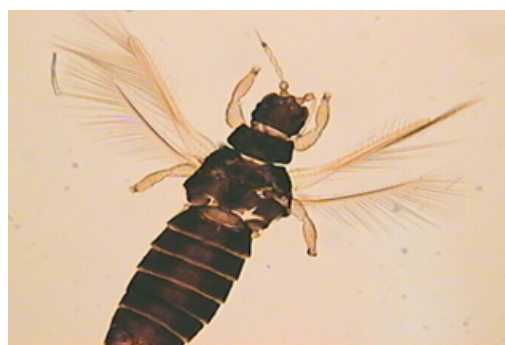
Figura 1 – Adulto de tripe da bananeira ( Heliothrips haemorrhoidalis Bouché).