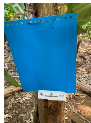
Figura 3 – Armadilhas cromotrópicas amarelas e azuis.

Os tisanópteros (Thysanoptera) são pequenos insetos com uma coloração que vai de amarela, passando por castanho-escuro até atingir a cor preta (Fig.1). A presença de dois pares asas franjadas nos seus adultos é característica (Fig.1).