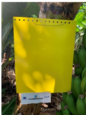
Figura 3 – Armadilhas cromotrópicas amarelas e azuis.