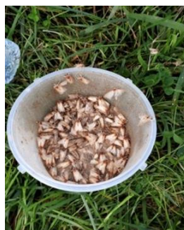
Figura 3 – Aspeto do conteúdo da armadilha grandes quantidades de adultos desta praga.