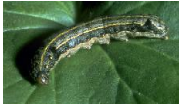
Figura 1 – Lagarta de Spodoptera littoralis .

Praga: Nóctua da pastagem Spodoptera littoralis Boisduval (Lepidoptera: Noctuidae)