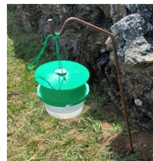
Figura 4 – Armadilha Funil.