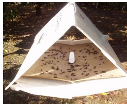
Figura 4 - Armadilha Delta com placa de cola e feromona sexual (no centro).

O adulto da traça da batata ( Phthorimaea operculella Zeller) é uma pequena borboleta pertencente às traças da batateira (Fig. 2). É uma praga importante principalmente da batata armazenada.