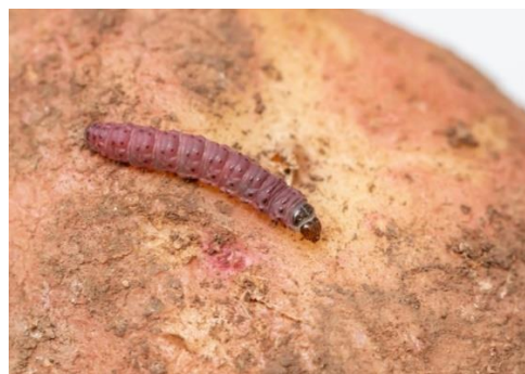
Figura 1- Lagarta de Phthorimaea operculella .

Phthorimaea operculella Zeller (Lepidoptera: Gelechiidae)