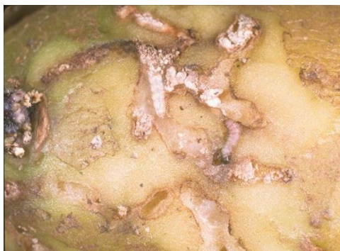
Figura 3- Estragos causados pelas lagartas de Phthorimaea operculella .