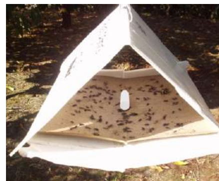
Figura 4 - Armadilha Delta com placa de cola e feromona sexual (no centro).

O adulto da traça da batata ( Phthorimaea operculella Zeller) é um lepidóptero pertencente às traças da batateira (Fig. 2). É uma praga importante principalmente da batata armazenada.