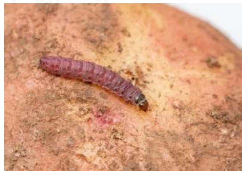
Figura 1- Lagarta de Phthorimaea operculella .

Cultura: Batateira Praga: Phthorimaea operculella Zeller Traça comum da batata (Lepidoptera: Gelechiidae)