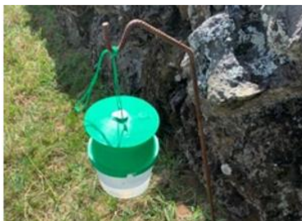
Figura 3 – Armadilha Funil com feromona específica utilizada na monitorização das borboletas (adultos) de M. unipuncta (Haworth).

A lagarta da pastagem ( Pseudaletia unipuncta Haworth) (Fig. 1) possui lateralmente 3 faixas longitudinais com pequenos pontos ou manchas negras que ajudam no seu reconhecimento visual (Fig. 1). Provoca pela sua alimentação grandes prejuízos nas pastagens e no milho.