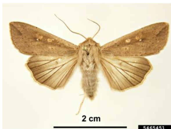
Figura 2 –Borboleta de Mythimna unipuncta (Haworth).