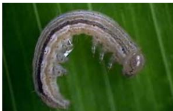
Figura 1 – Lagarta de Mythimna unipuncta (Haworth).

Cultura: Milho/Pastagem Praga: Lagarta da Pastagem Mythimna unipuncta (Haworth) (Lepidoptera: Noctuidae)