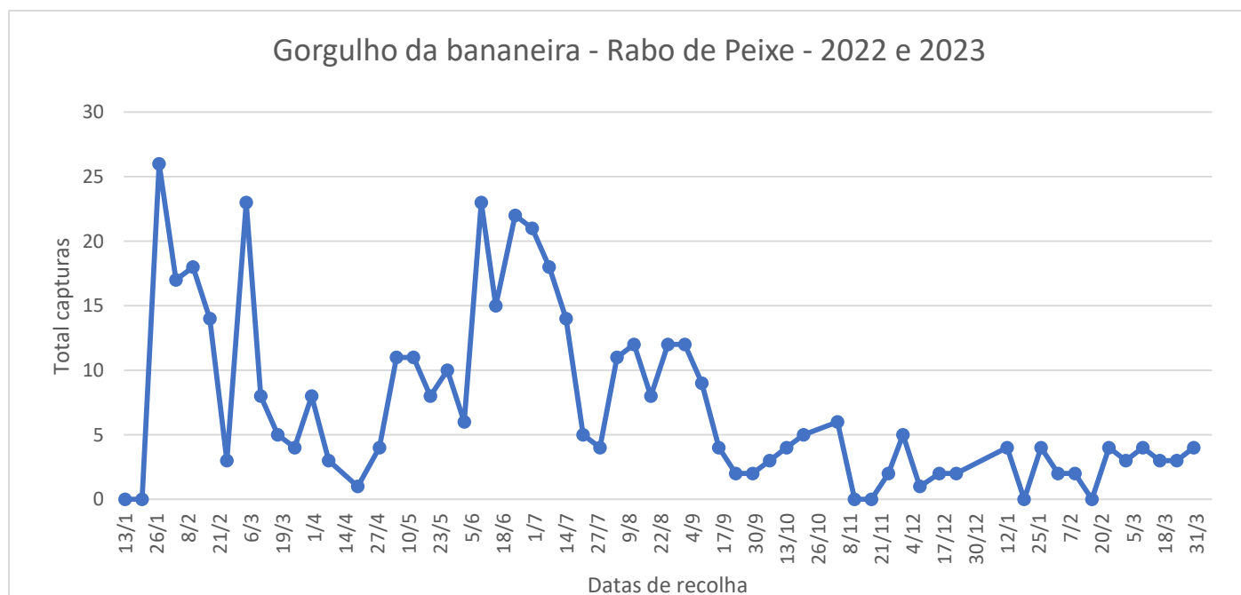
Figura 2 - Evolução das capturas de adultos de Cosmopolites sordidus no pomar de bananeira na freguesia de Rabo de Peixe, no ano de 2022 e 2023.