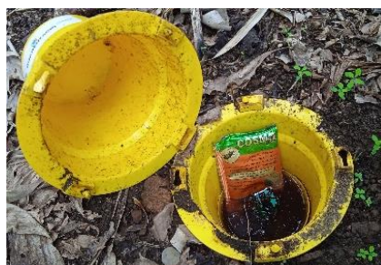
Figura 3 - Armadilha Cosmotrack com a feromona de agregação Cosmoplus

O gorgulho da bananeira (Fig. 1) é uma praga-chave da bananeira nos Açores.