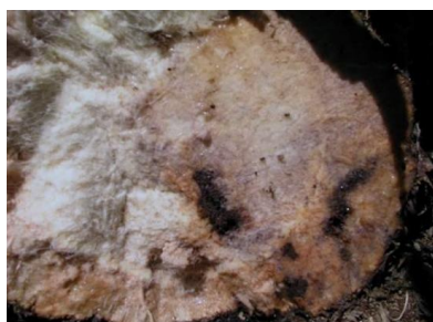
Figura 2- Galerias causadas pelas larvas de gorgulho no interior do pseudo-caule da bananeira.