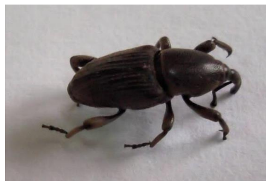
Figura 1 - Adulto de gorgulho da bananeira.