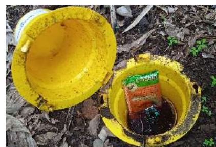
Figura 3 - Armadilha Cosmotrack com a feromona de agregação Cosmoplus

O gorgulho da bananeira (Fig. 1) é uma praga-chave da bananeira nos Açores.