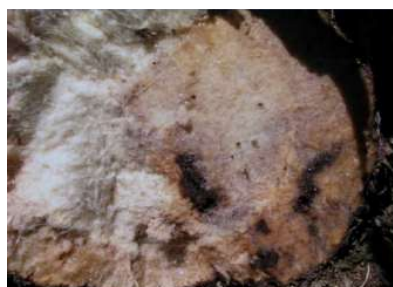
Figura 2- Galerias causadas pelas larvas de gorgulho no interior do pseudo-caule da bananeira.