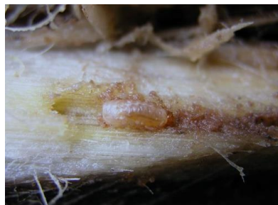
Figura 2- Galerias causadas pelas larvas de gorgulho no interior do pseudo-caule da bananeira.