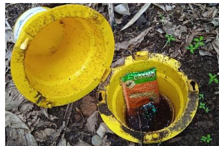
Figura 3 - Armadilha Cosmotrack com a feromona de agregação Cosmoplus

O gorgulho da bananeira (Fig. 1) é uma praga-chave da bananeira nos Açores.