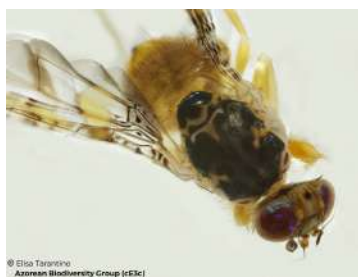
Figura 2- Adulto macho de Ceratitis capitata Wied.