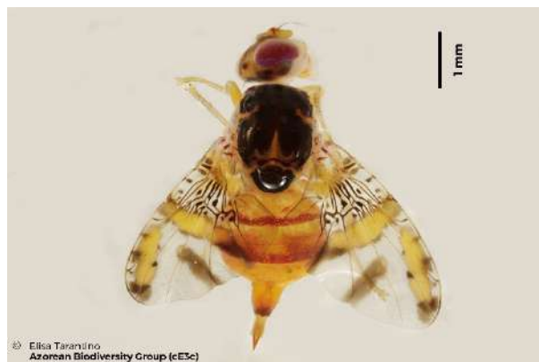
Figura 1- Adulto fêmea de Ceratitis capitata Wied.

Praga: Mosca do Mediterrâneo Ceratitis capitata Wiedemann (Diptera: Tephritidae)