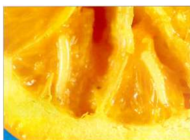
Figura 3- Larvas de mosca do mediterrâneo no interior de laranja.