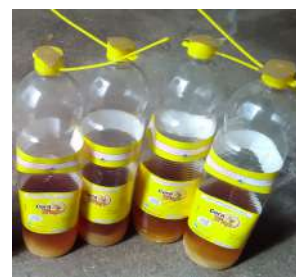
Figura 5 - Armadilha Ceratrap com atrativo alimentar.

A mosca do Mediterrâneo ( Ceratitis capitata Wied.) (Fig. 1 e 2) é mais pequena que a mosca doméstica. Possui um corpo escuro com duas listas amarelas no abdómen (Fig. 1 e 2). As asas apresentam sinais castanhos, amarelos, pretos e brancos (Fig. 1 e 2).