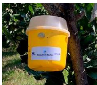
Figura 4 - Armadilha Tephri com atrativo alimentar (trimolure).