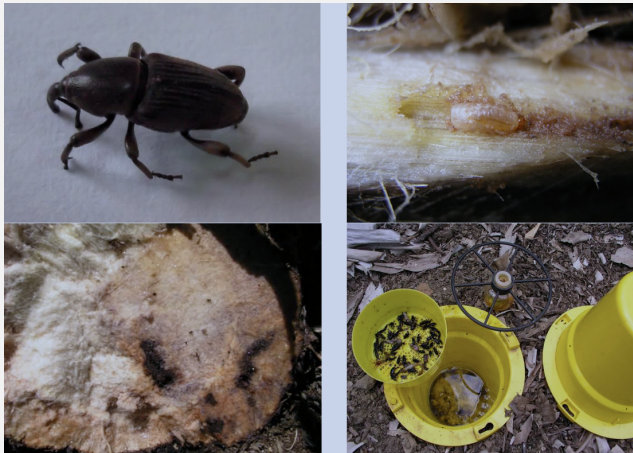
Figura 1 - Adulto e larva de gorgulho, estragos no pseudocaule e armadilha monitorização.