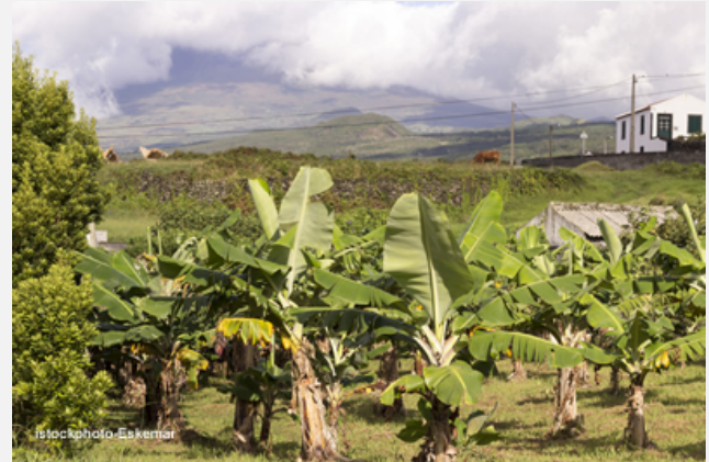
Figura 2 - Parcela de bananeiras