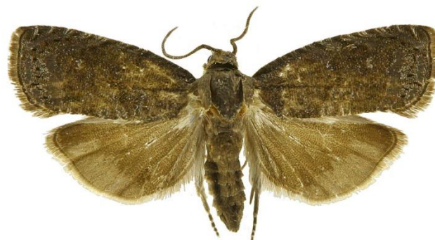
Figura 1- Borboleta (Adulto) de Grapholita molesta Busck.

Cultura: Macieiras e Ameixieiras Praga: Traça Oriental Grapholita molesta Busck (Lepidoptera: Tortricidae)