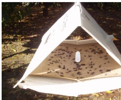
Figura 3 – Armadilha Delta com base de placa de cola e feromona sexual específica para Grapholita molesta Busck.

O adulto da traça oriental ( Grapholita molesta Busck) é uma borboleta com uma coloração cinza e manchas escuras nas asas (Fig.1) que voa ao anoitecer.