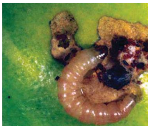
Figura 2 – Lagarta de Grapholita molesta Busck e estragos no fruto.