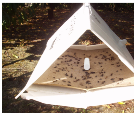
Figura 3 – Armadilha Delta com base de placa de cola e feromona sexual específica para Grapholita molesta Busck.

O adulto da traça oriental ( Grapholita molesta Busck) é uma borboleta com uma coloração cinza e manchas escuras nas asas (Fig.1) que voa ao anoitecer.