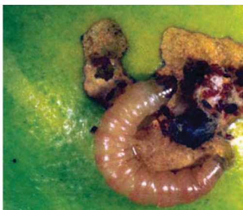
Figura 2 – Lagarta de Grapholita molesta Busck e estragos no fruto.