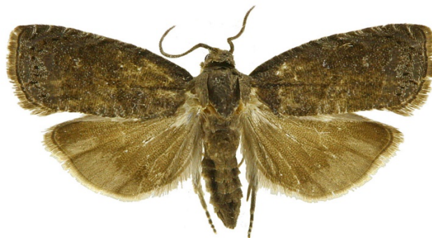
Figura 1- Borboleta (Adulto) de Grapholita molesta Busck.

Cultura: Macieiras e Ameixieiras Praga: Traça Oriental Grapholita molesta Busck (Lepidoptera: Tortricidae)