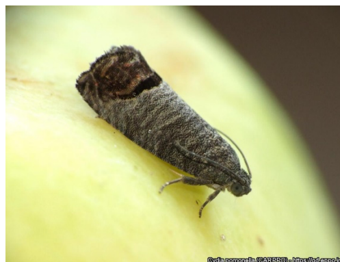
Figura 1 - Borboleta (adultos) de Bichado-da-macieira.

Cultura: Macieira Praga: Bichado-da-macieira Cydia pomonella L. (Lepidoptera: Tortricidae)