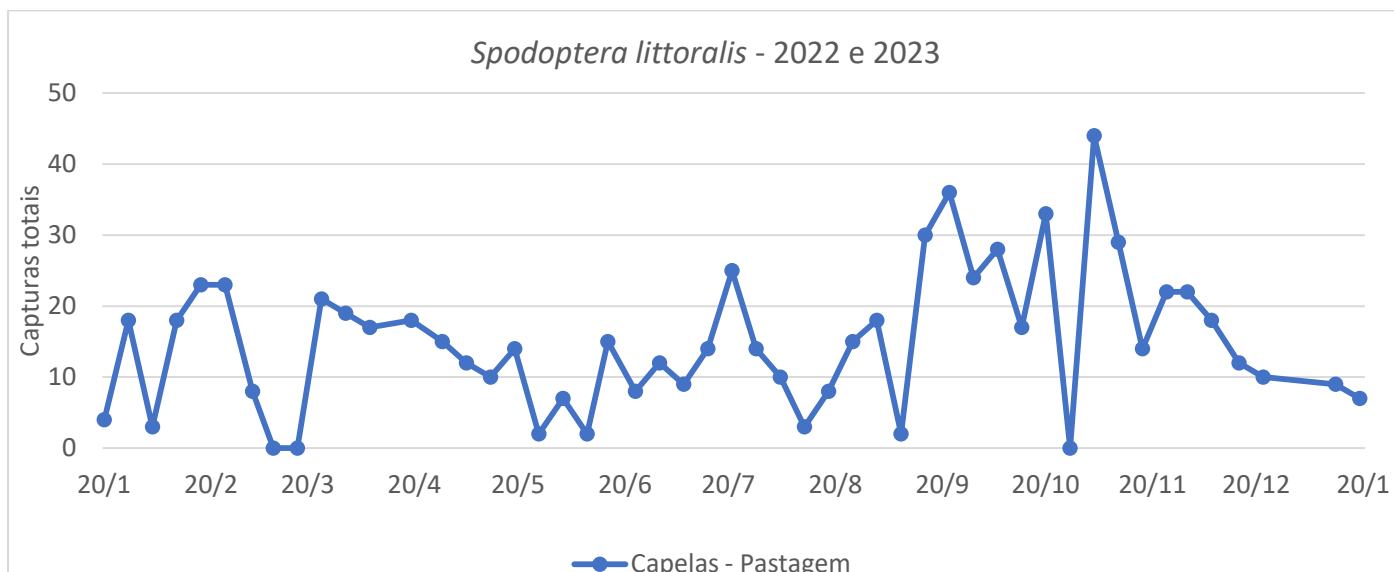
Figura 1 - Evolução das capturas de adultos de S. littoralis por armadilha e por dia, nas parcelas monitorizadas na freguesia das Capelas na ilha de S. Miguel, no ano de 2022 e 2023.