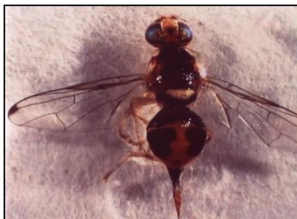
Figura 1 – Adulto fêmea de Bactrocera oleae

As asas são transparentes com pequenas manchas castanhas na extremidade (Fig. 1).