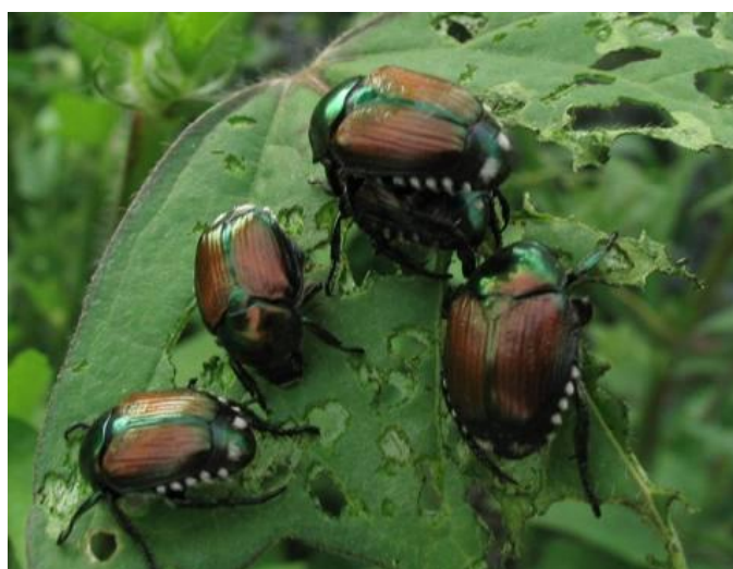
Figura 1 – Adultos de Popillia japonica .

O escaravelho japonês ( Popillia japonica Newman) (Fig. 1) foi introduzido na ilha Terceira na década de 80. No ano de 1996, a sua presença foi detetada na ilha do Faial, e em 2003 foi capturado o primeiro inseto adulto na ilha de São Miguel. Atualmente não estando presente apenas na ilha de Santa Maria e constitui um potencial perigo de disseminação para o território continental ou mesmo outros países da Europa.