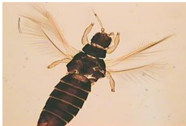
Figura 1 – Adulto de tisanóptero.

São insetos que se alimentam sobre os frutos e folhas causando estragos devido à sua armadura bucal escarificadora que levam ao aparecimento de manchas pardas e de uma coloração cobreada, depreciando assim as bananas comercialmente e deixando feridas abertas que podem ser uma porta de entrada à introdução nestas de agentes patogénicos.