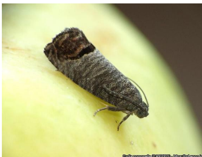
Figura 1 e 2 – Larva (acima) e adulto (baixo) do bichado da macieira ( Cydia pomonella (L.)).