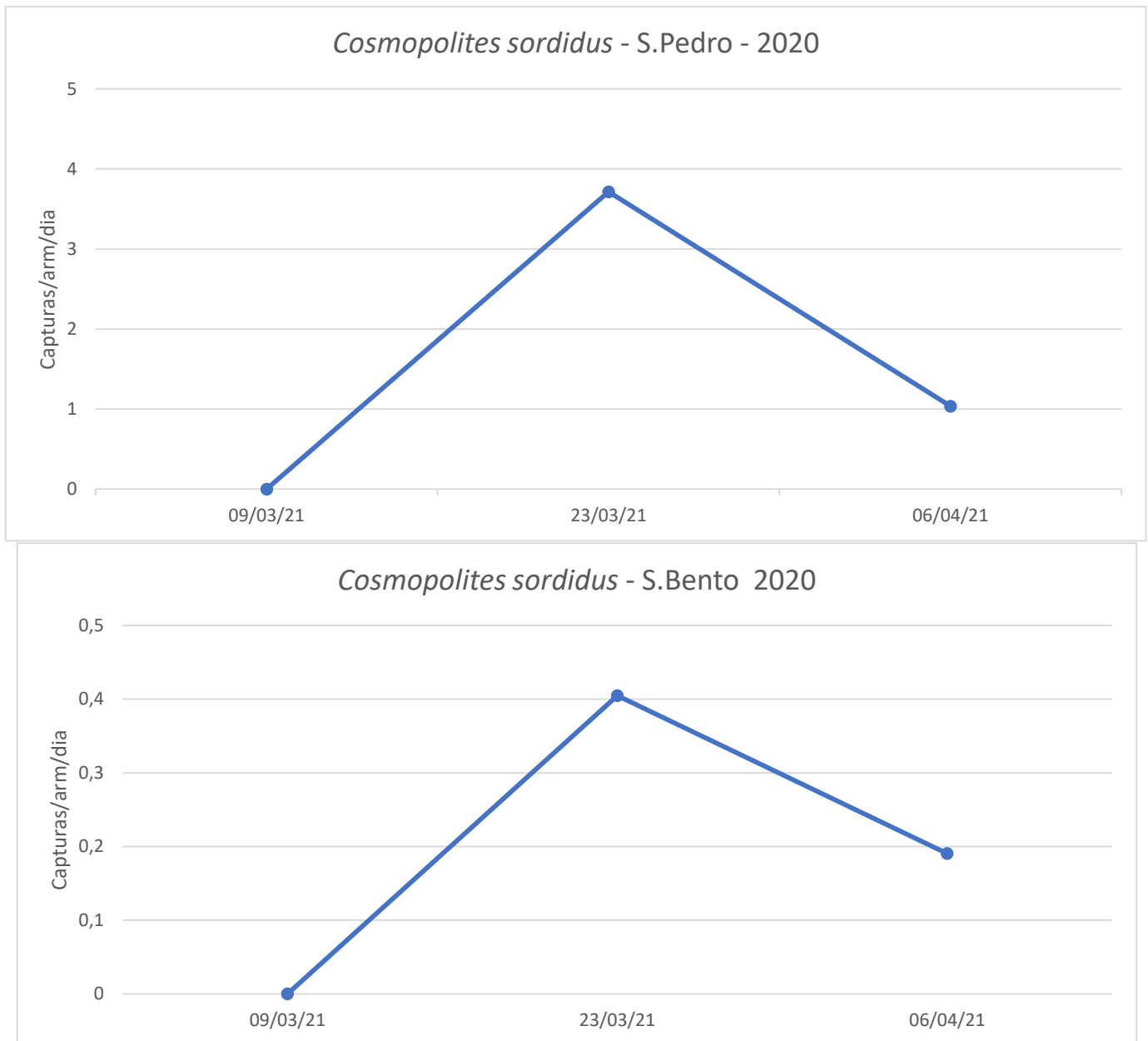
Figura 3 - Evolução das capturas de adultos de C. sordidus no pomar de bananeiras nas armadilhas Stopweevil, da freguesia de São Bento, no ano 2021.