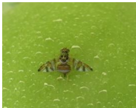
Figura 1 - Fêmea adulta de Ceratitis capitata .

No âmbito do projeto CUARENTAGRI, um pomar de laranjeira que foi alvo da monitorização na freguesia de Urzelina (Fig. 1). O seu pico populacional de adultos foi atingido no final do mês de agosto (Fig. 1).